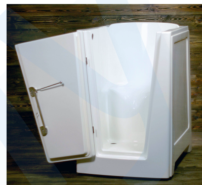
levá stranová varianta

Doporučené umístění odpadního otvoru max. 90 mm nad úrovní podlahy