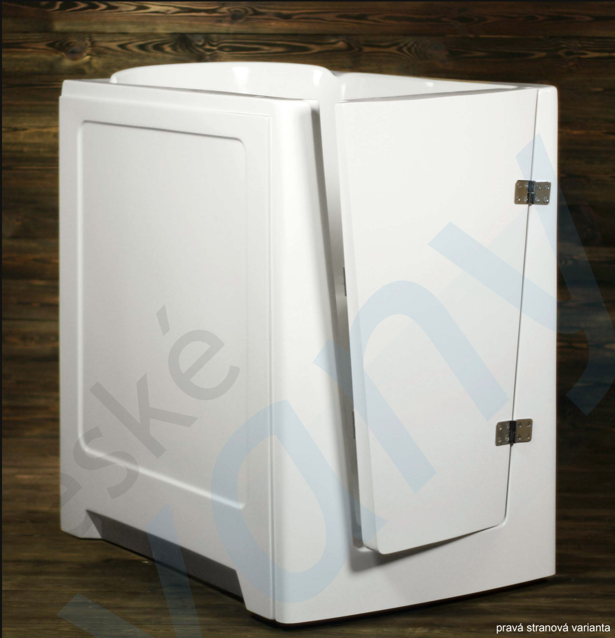
pravá stranová varianta