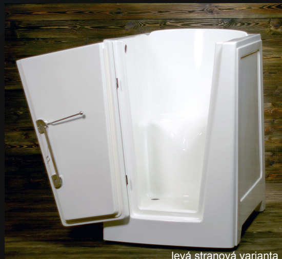
levá stranová varianta

B.A.R. Praha, s.r.o. Kloboukova 2172/5 148 00 Praha 4 – Chodov www.ceske-koupelny.cz