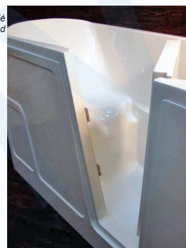
pravá stranová varianta