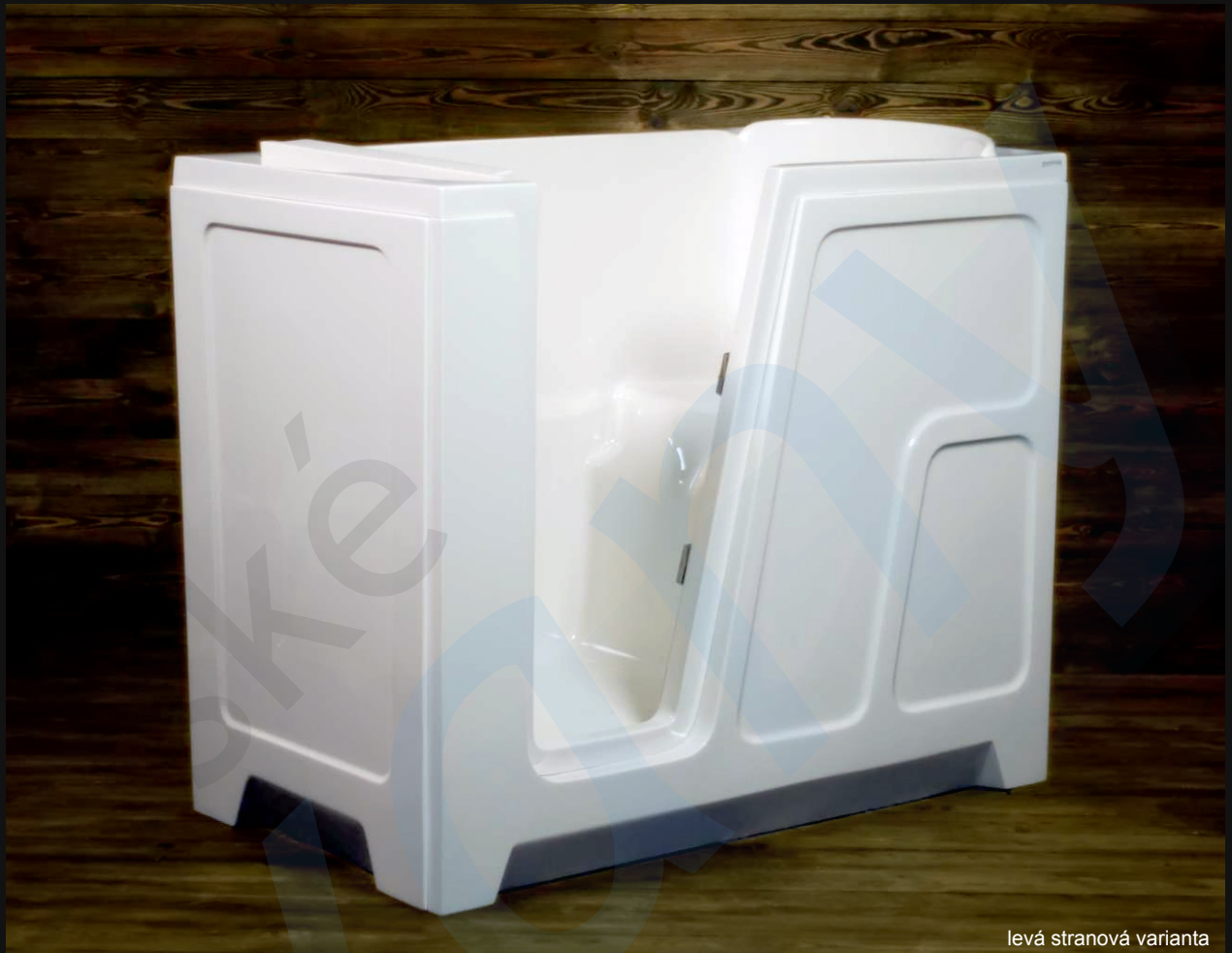
levá stranová varianta