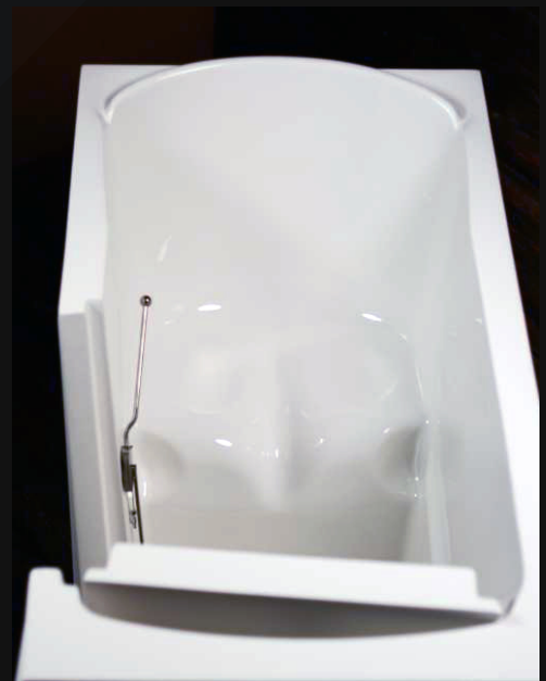
pravá stranová varianta

B.A.R. Praha, s.r.o. Kloboukova 2172/5 148 00 Praha 4 – Chodov www.ceske-koupelny.cz